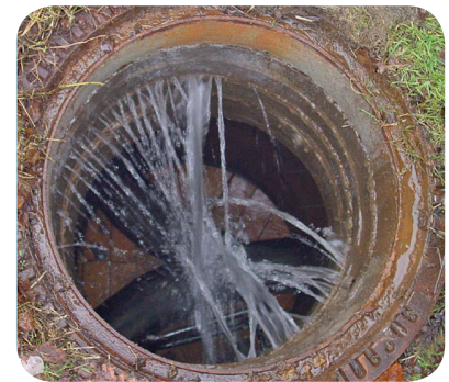
Grundwassereintritt im undichten Kanalschacht.